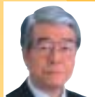
矢立一郎氏 神戸市長